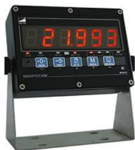
Микросим (M0601, M0601-БМ-2)

Общий вид индикаторов представлен на рисунке 2.