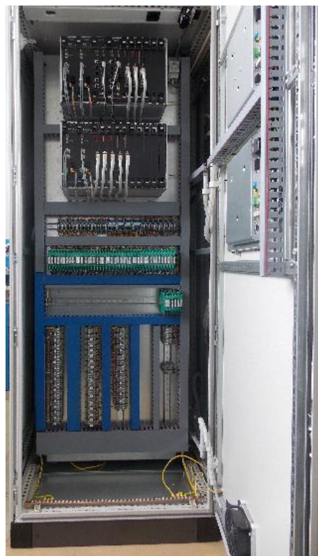
Рисунок 2. Внутренний вид ИВК