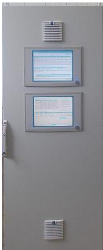
Рисунок 1. Внешний вид ИВК