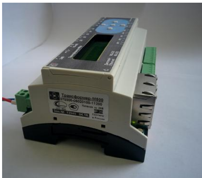
Рисунок 2 – Знак утверждения типа