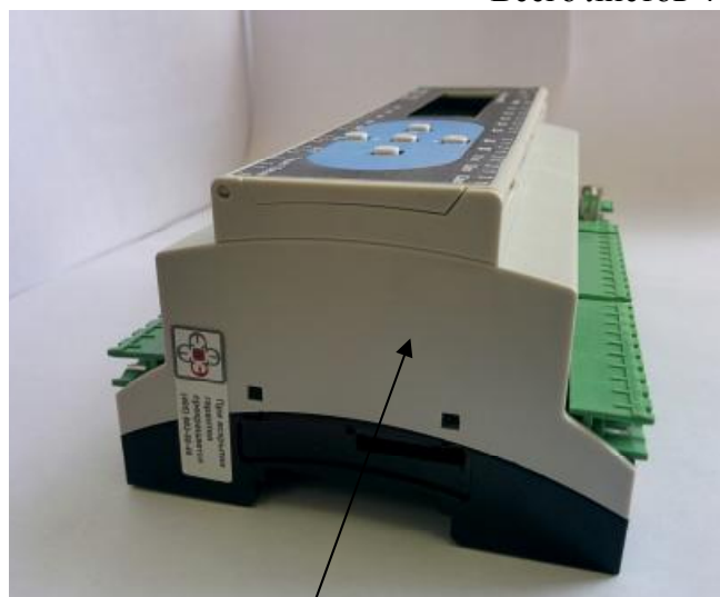
Место нанесения знака поверки