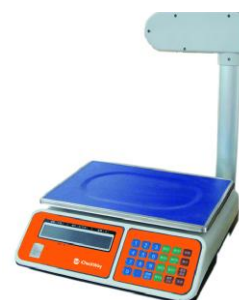
Р - Дисплей на стойке