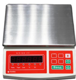
В - Дисплей на корпусе