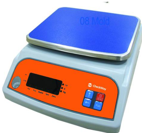
Рисунок 3 - Общий вид весов модификации CheckWay CW-120B[3][4]