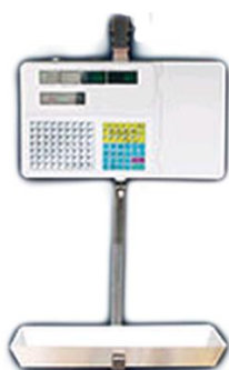
Н - ГПУ под корпусом