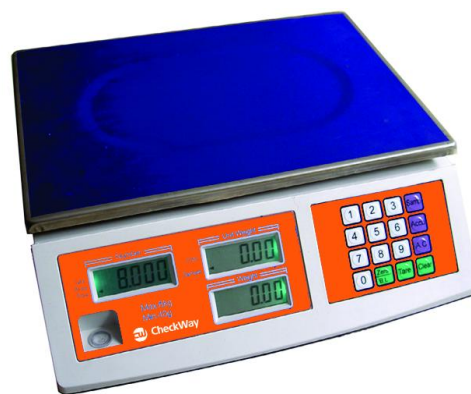
Рисунок 6 - Общий вид весов модификации CheckWay CW-210B[3][4]