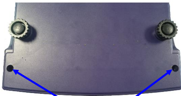
Пломба для нанесения знака поверки

Для модификаций CheckWay CW-100[2][3][4]), CheckWay CW-110[2][3][4]), CheckWay CW-120[2][3][4]) и CheckWay CW-130[2][3][4]); CheckWay CW-200[2][3][4]), CheckWay CW-210[2][3][4]), CheckWay CW-220[2][3][4]), CheckWay CW-230[2][3][4]), CheckWay CW-240[2][3][4]), CheckWay CW-250[2][3][4])