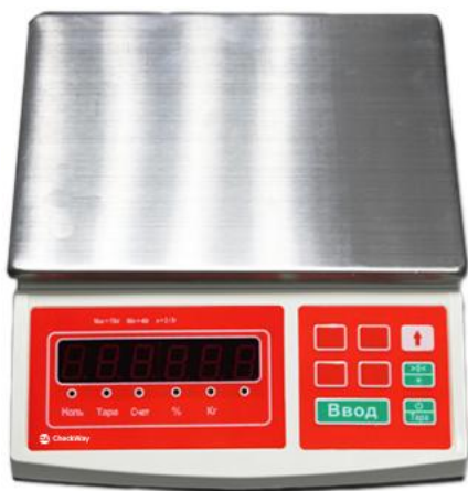
Рисунок 1 - Общий вид весов модификации CheckWay CW-100B[3][4]

Общий вид весов показан на рисунках 1 - 12. Возможные способы размещения терминала в составе весов показаны на рисунке 13.