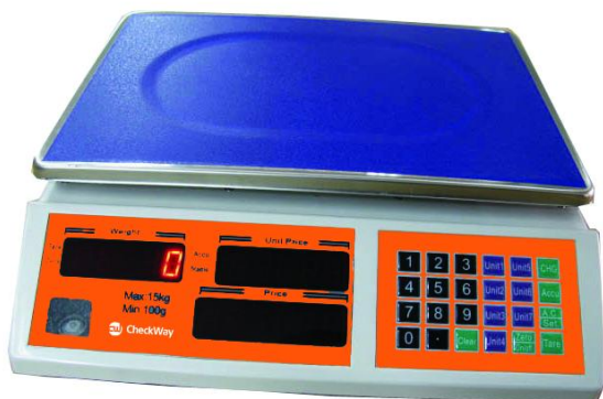
Рисунок 5 - Общий вид весов модификации CheckWay CW-200B[3][4]