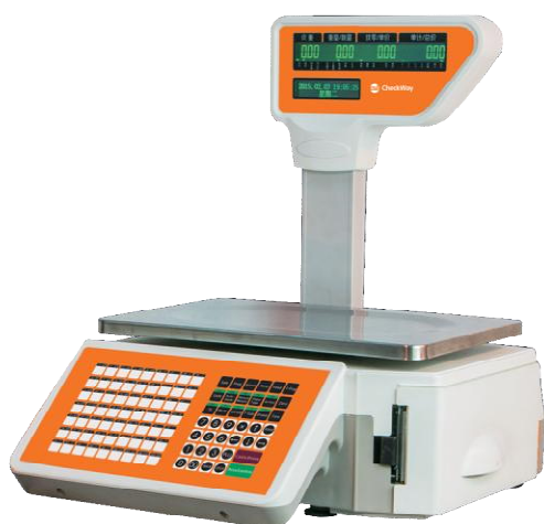
Рисунок 11 - Общий вид весов модификации CheckWay CW-500P[3][4]