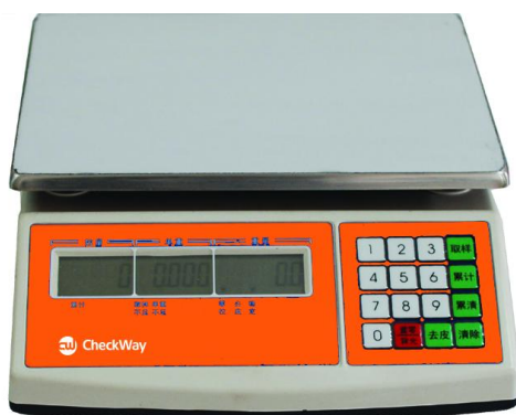
Рисунок 7 - Общий вид весов модификации CheckWay CW-220B[3][4]