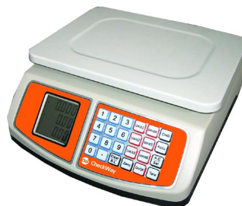
Рисунок 10 - Общий вид весов модификации CheckWay CW-250B[3][4]