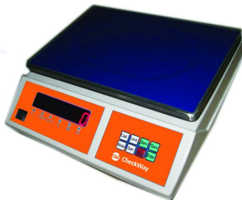
Рисунок 2 - Общий вид весов модификации CheckWay CW-110B[3][4]