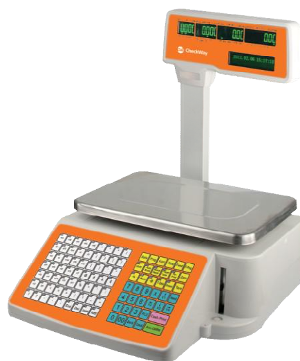
Рисунок 12 - Общий вид весов модификации CheckWay CW-510P[3][4]