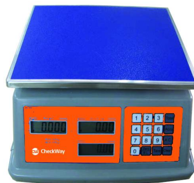
Рисунок 8 - Общий вид весов модификации CheckWay CW-230B[3][4]