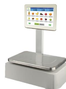
С - Дисплей самообслуживания на стойке