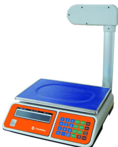
Рисунок 9 - Общий вид весов модификации CheckWay CW-240P[3][4]