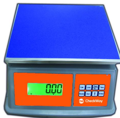
Рисунок 4 - Общий вид весов модификации CheckWay CW-130B[3][4]