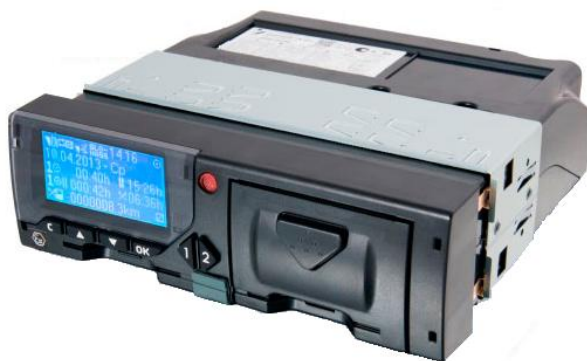
Рисунок 1 – Общий вид тахографа