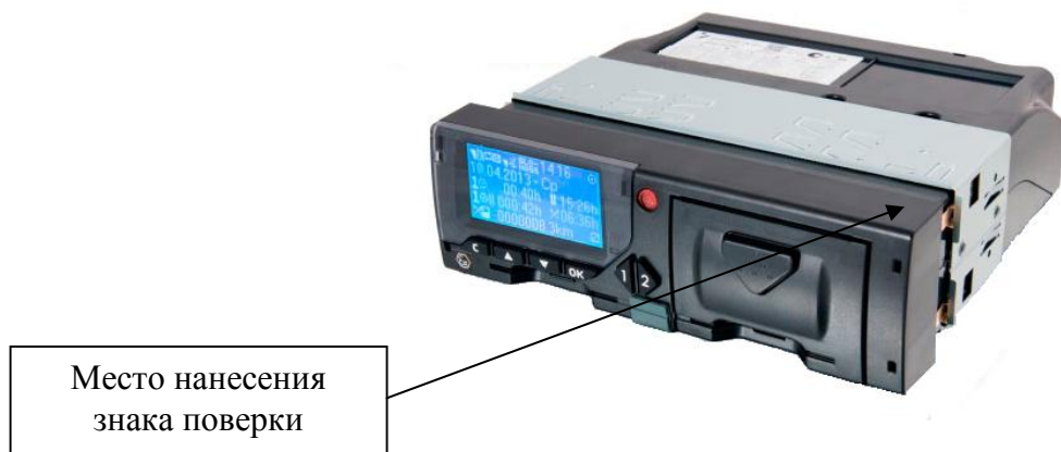
Рисунок 1 – Общий вид тахографа

Внешний вид тахографов приведен на рисунках 1, 2. На рисунке 2 приведены схема пломбировки тахографов от несанкционированного доступа и место нанесения знака утверждения типа.