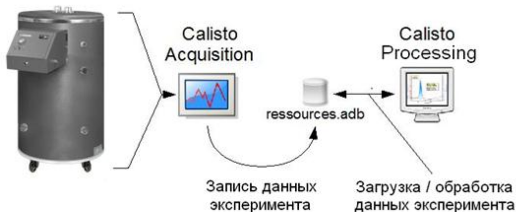
Рисунок 3 – Схема взаимодействия встроенного ПО калориметра и модулей ПО «CALISTO»

Каждая копия ПО «CALISTO» может быть использована только зарегистрированным пользователем (зарегистрированной организацией), так как требует активации, которая возможна только путем ввода имени и пароля, предоставленного производителем конечному пользователю калориметра.