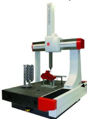
Рисунок 8 – Общий вид КИМ модификации UNIVERSAL