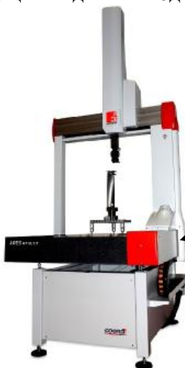
Рисунок 2 – Общий вид КИМ модификации ARES