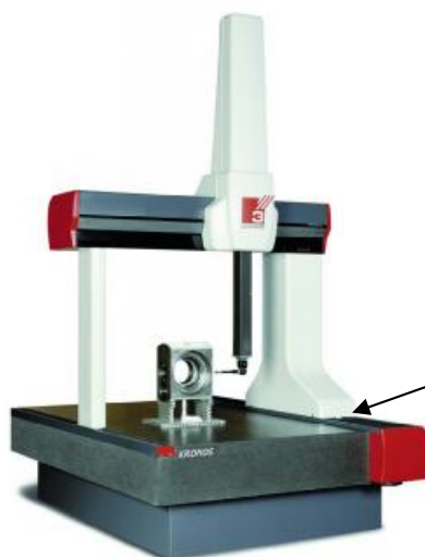
Рисунок 5 – Общий вид КИМ модификации HERA NT