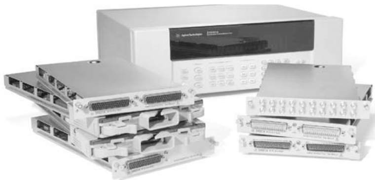
Рисунок 1 – Общий вид мультиметра и сменных модулей