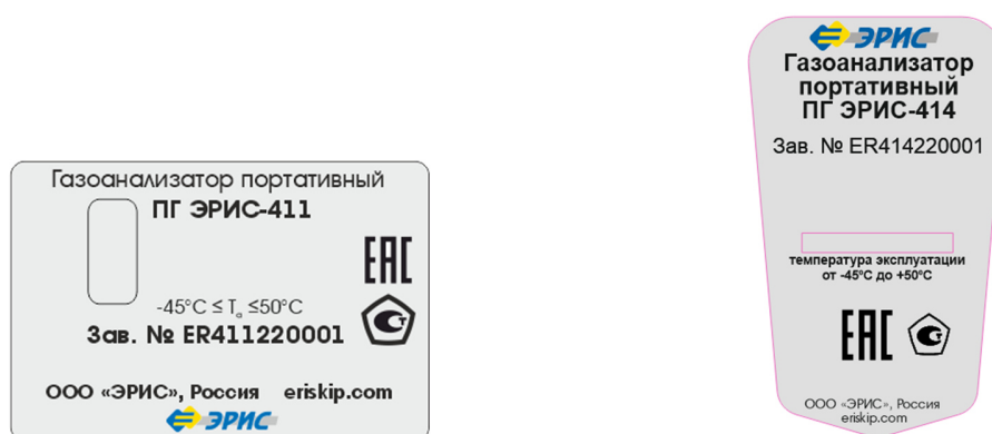
Рисунок 1 - Маркировочные таблички газоанализаторов ПГ ЭРИС-411, ПГ ЭРИС-414 с указанием заводского номера и знака утверждения типа

Для защиты от несанкционированного доступа в газоанализаторах предусмотрена установка разрушаемой пломбы-наклейки изготовителя. Общий вид газоанализаторов с указанием мест пломбирования представлен на рисунках 2-5.