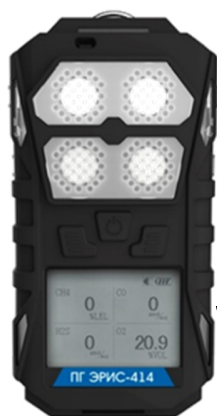
Рисунок 4- Общий вид газоанализатора ПГ ЭРИС-414-1 и схема пломбировки