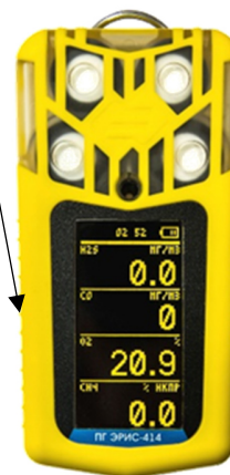
Рисунок 5 - Общий вид газоанализатора ПГ ЭРИС-414-2 и схема пломбировки