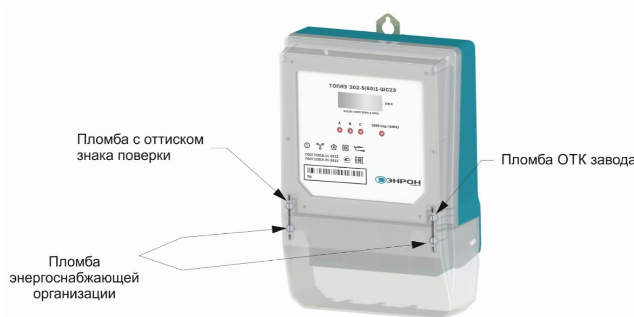
Рисунок 3 – Общий вид модификации счетчика ТОПАЗ 302