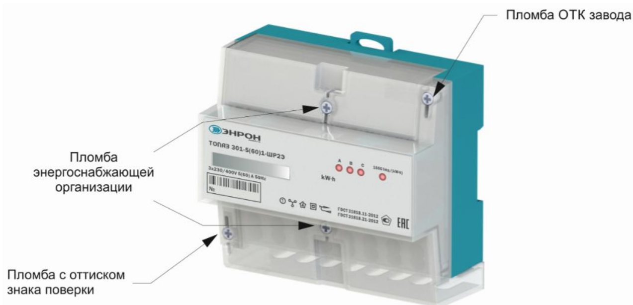
Рисунок 2 – Общий вид модификации счетчика ТОПАЗ 301

Фотографии базовых моделей счётчиков с местами опломбирования и место установки пломбы с оттиском знака поверки представлены на рисунках 2-3.