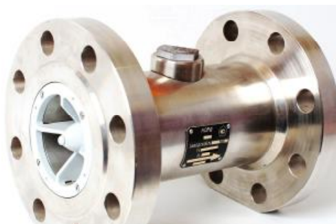
Рисунок 1 – Общий вид преобразователя первичного преобразователей расхода турбинных НОРД

Общий вид преобразователя первичного преобразователей расхода турбинных НОРД приведен на рисунке 1. Общий вид преобразователя первичного преобразователей расхода турбинных МИГ-М приведен на рисунке 2. Общий вид датчиков магнитоиндукционных НОРД-И2Д-У преобразователей расхода турбинных НОРД, МИГ-М представлен на рисунке 3.