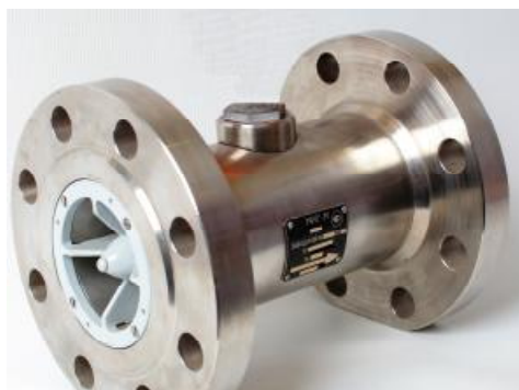
Рисунок 2 – Общий вид преобразователя первичного преобразователей расхода турбинных МИГ-М