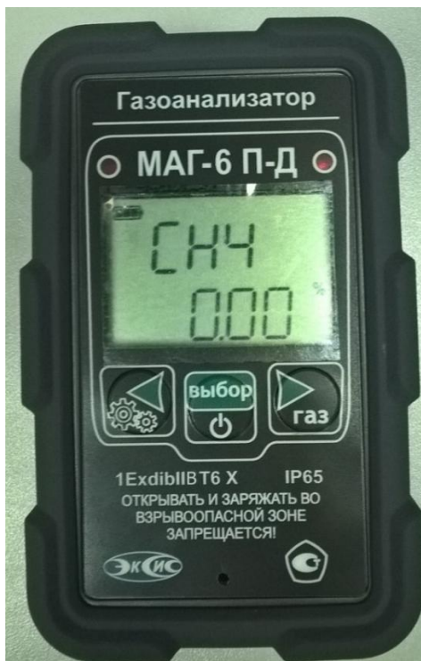
Рисунок 3 – Внешний вид газоанализатора МАГ-6 исполнения МАГ-6 П-Д