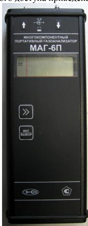
Рисунок 1 – Внешний вид газоанализатора МАГ-6 исполнения МАГ-6 П-К

Внешний вид газоанализаторов приведен на рисунках 1- 8. Схема пломбирования газоанализаторов от несанкционированного доступа приведена на рисунке 9.