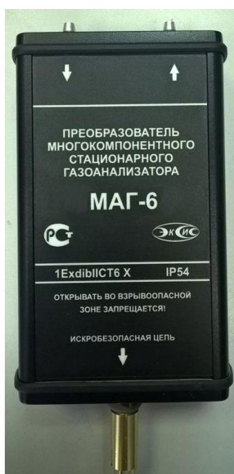
Рисунок 7 – Внешний вид измерительного преобразователя МАГ-6