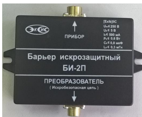
Рисунок 8 – Внешний вид барьера искрозащиты БИ-2П