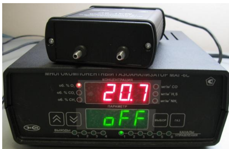
Рисунок 5 – Внешний вид газоанализатора МАГ-6 исполнения МАГ-6 С-1 (с одним внешним измерительным преобразователем МАГ-6)