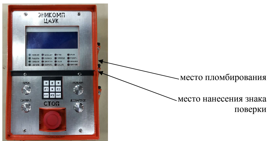
Рисунок 2 - Внешний вид контроллеров модификаций ЦАУК-2.x.x.0 с указанием мест пломбировки и нанесения знаков поверки