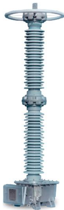
Рисунок 1 - Внешний вид средства измерений

Место пломбировки от несанкционированного доступа и обозначение места нанесения знака поверки представлены на рисунке 2.