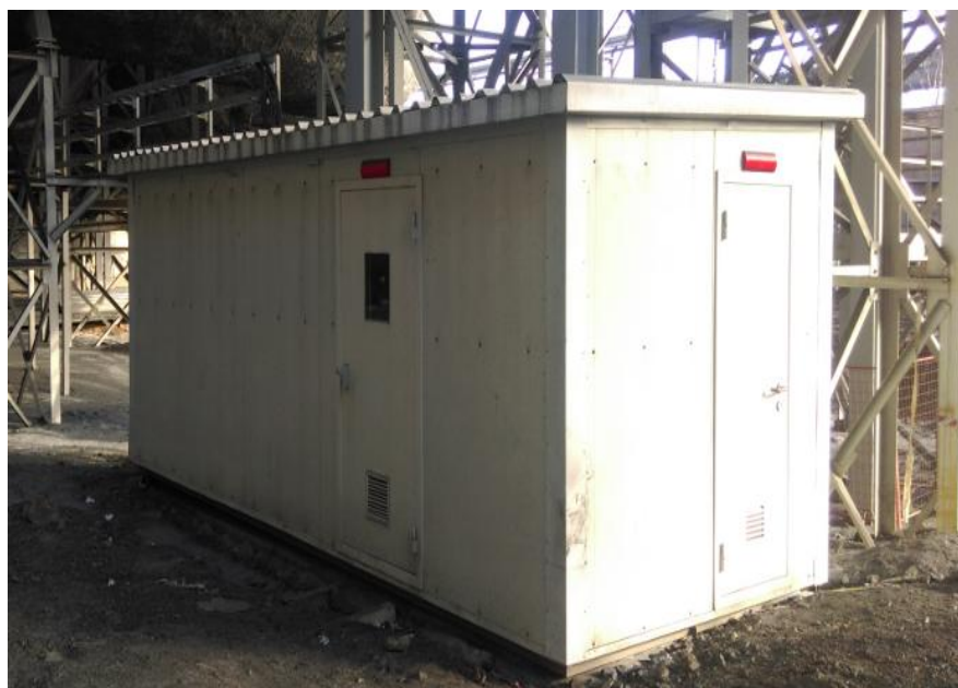
Рисунок 1 - Внешний вид контейнера

Внешний вид СНКГВ (контейнер) приведен на рисунке 1, вид внутри - на рисунке 2.