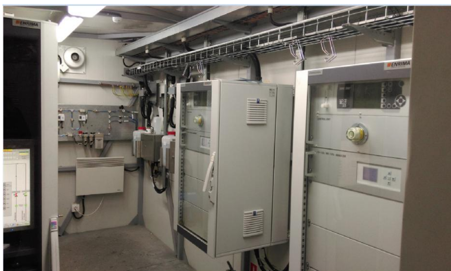
Рисунок 2 - Вид системы внутри контейнера