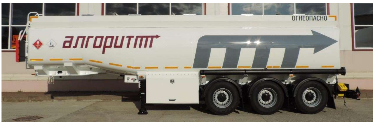
Рисунок 1 - Общий вид полуприцепа-цистерны ППЦ-34