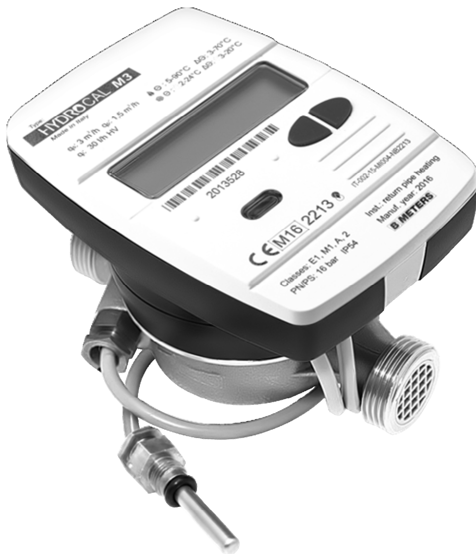
Рисунок 1 - Общий вид теплосчетчиков Схемы пломбировки теплосчетчиков представлены на рисунках 2-4.