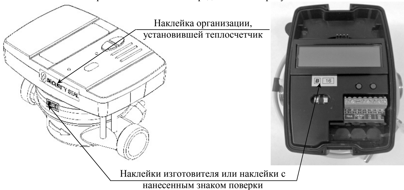
Рисунок 2 - Схемы пломбировки вычислителя