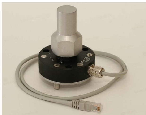
Рисунок 1 - Внешний вид измерителей угла наклона двухкоординатного ИН-ДЗ(А)

Внешний вид измерителей представлен на рисунке 1.