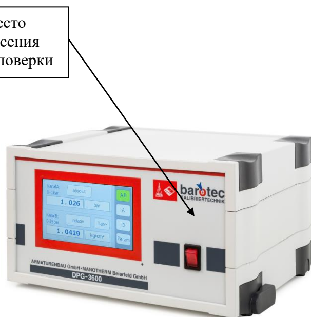
Рисунок 2 - Общий вид контроллеров-калибраторов давления DPG 3600, DPG 3600 HD

Пломбирование калибраторов не предусмотрено.