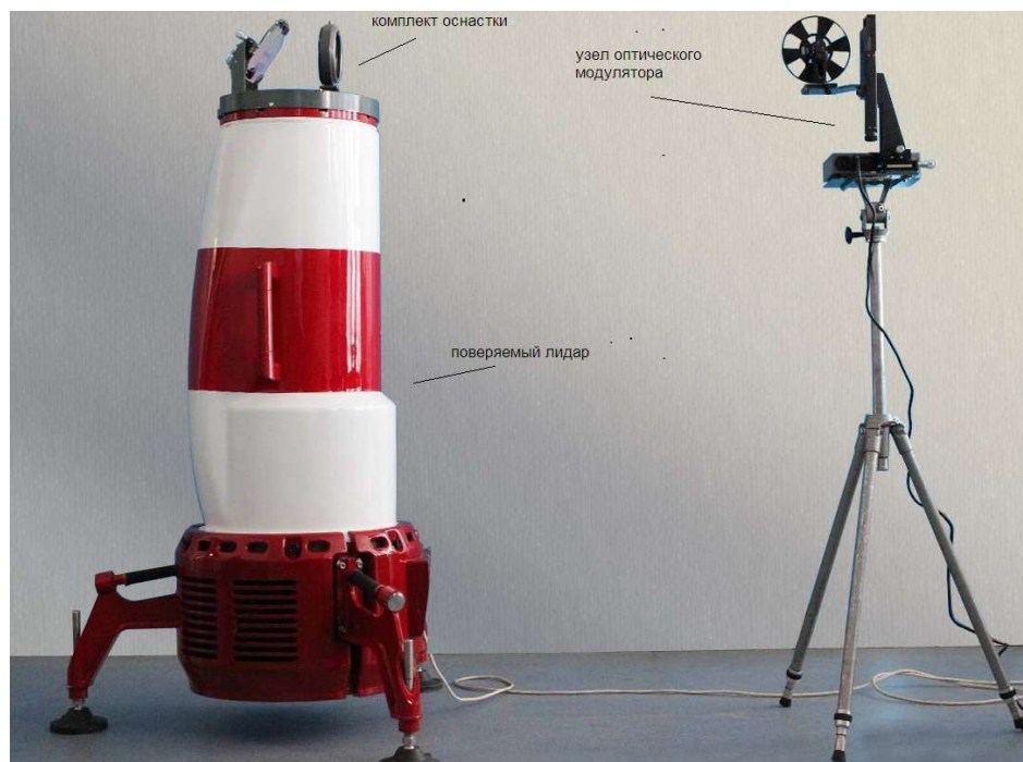
Рисунок 1 - Общий вид стенда

Комплект оснастки для профилометра представляет собой оптическую систему и предназначен для фокусировки выходного излучения приёмо-передающей системы профилометра на торцевую грань вращающегося диска.