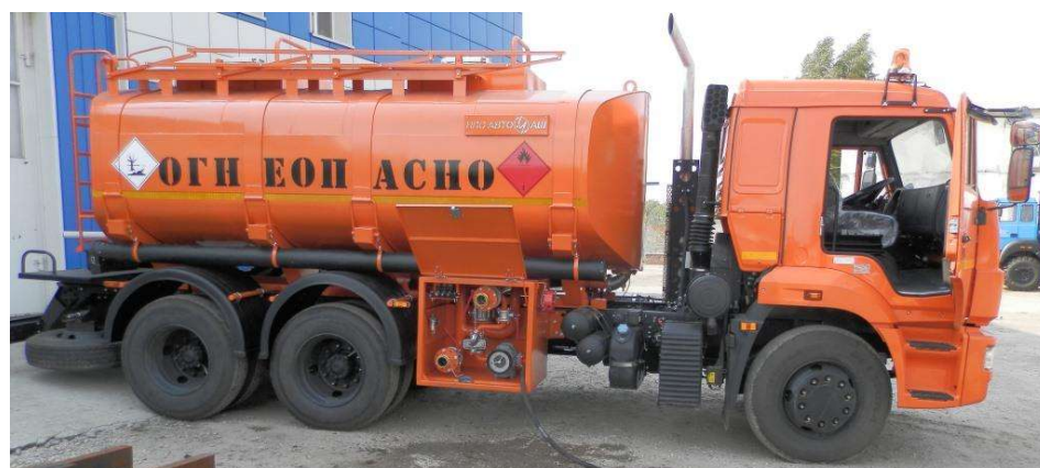
Рисунок 2 - Общий вид автотопливозаправщика АТЗ-14,0

Схема пломбировки для защиты от несанкционированного изменения положения указателя уровня налива, обозначение места нанесения знака поверки представлены на рисунке 3.