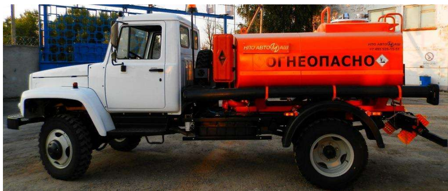
Рисунок 1 - Общий вид автоцистерны АЦ-4,5

Общие виды АЦ и АТЗ представлены на рисунках 1 и 2.