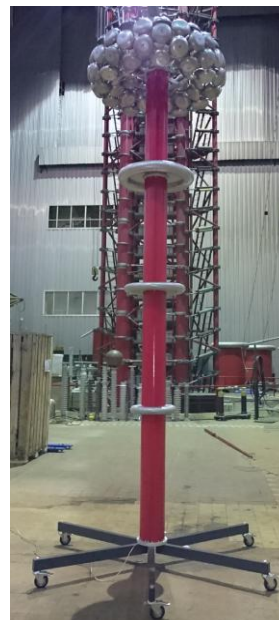
Рисунок 1 - Общий вид средства измерений