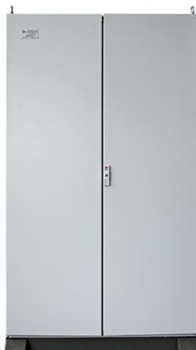
Рисунок 2 - Внешний вид шкафа кроссировочного БЛИЖ.408320.151.037