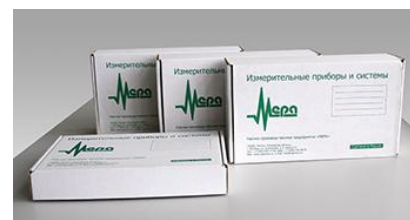
Рисунок 3 - Внешний вид комплекта ЗИП БЛИЖ.402490.015.058