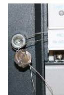
Рисунок 8 - Внешний вид пломбирования крейта МИС-036R с установленными в ней модулями