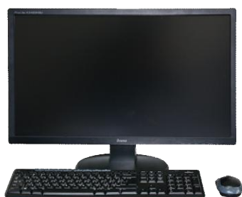
Рисунок 4 - Внешний вид пульта управления БЛИЖ.423600.010.016