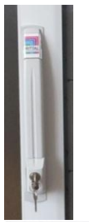
Рисунок 6 - Внешний вид замка комплекса измерения, регистрации и отображения БЛИЖ.401201.011.981