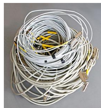
Рисунок 5 - Внешний вид комплекта кабелей БЛИЖ.402490.018.212