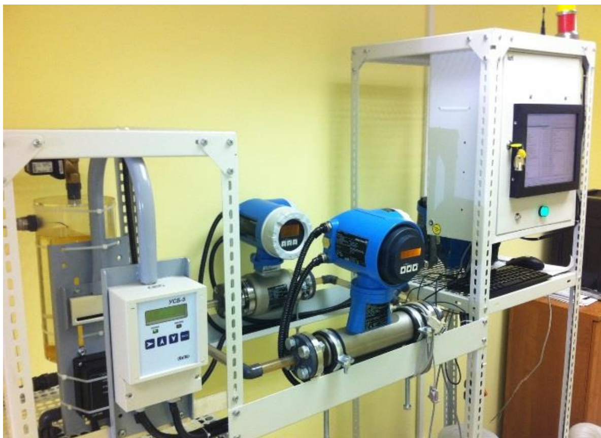
Фото 1 - Общий вид комплекса измерительного автоматизированного учета алкогольной продукции "ALCOSPOT-M"

Продолжительность автономной работы, в случае аварийных сбоев в его электроснабжении, без подключения внешней нагрузки, составляет не менее 20 минут после окончания подачи электропитания при полной зарядке аккумулятора ИБП.