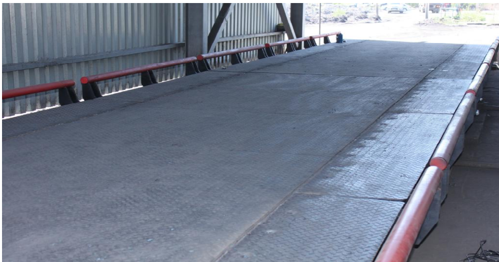
Рисунок 1 - Общий вид весов ТРИТОН-С

Общий вид весов неавтоматического действия модификации ТРИТОН-С представлен на рисунке 1.