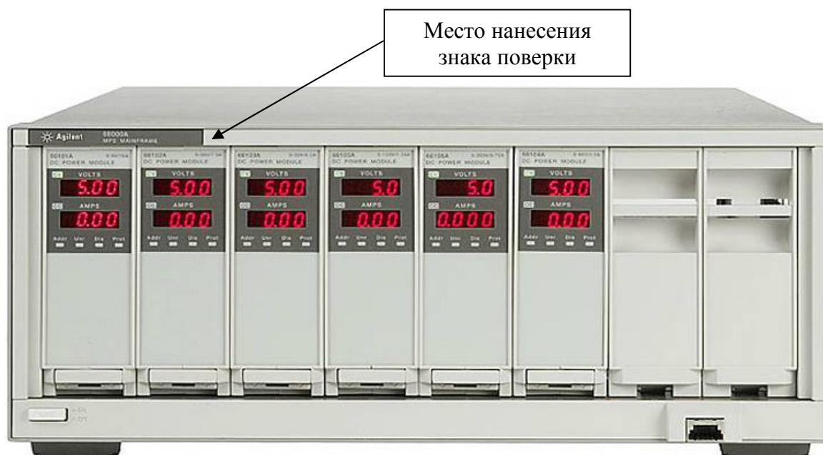
Рисунок 1 - Общий вид источников

При оформлении внешнего вида источников могут использоваться логотипы компаний «Agilent Technologies» или «Keysight Technologies».