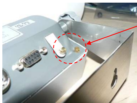
Схема пломбировки от несанкционированного доступа приведена на рисунке 3.

Винты с отверстиями для установки проволочной пломбы