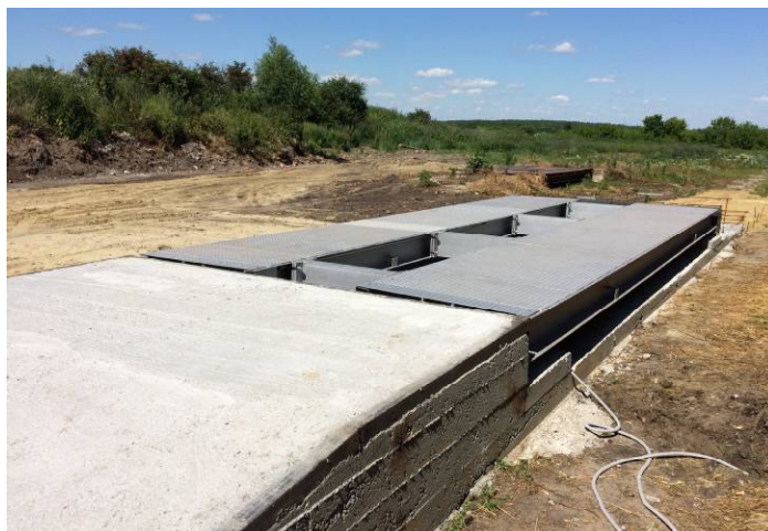
Рисунок 1 - Общий вид ГПУ весов