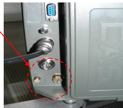
CI-200A и CI-200D

Винты с отверстиями для установки проволочной пломбы