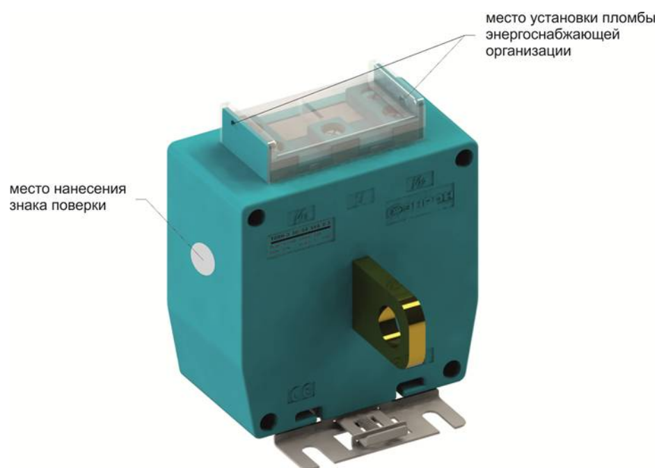
Рисунок 4 - Модификация ТОПН-Э с указанным местом нанесения знака поверки