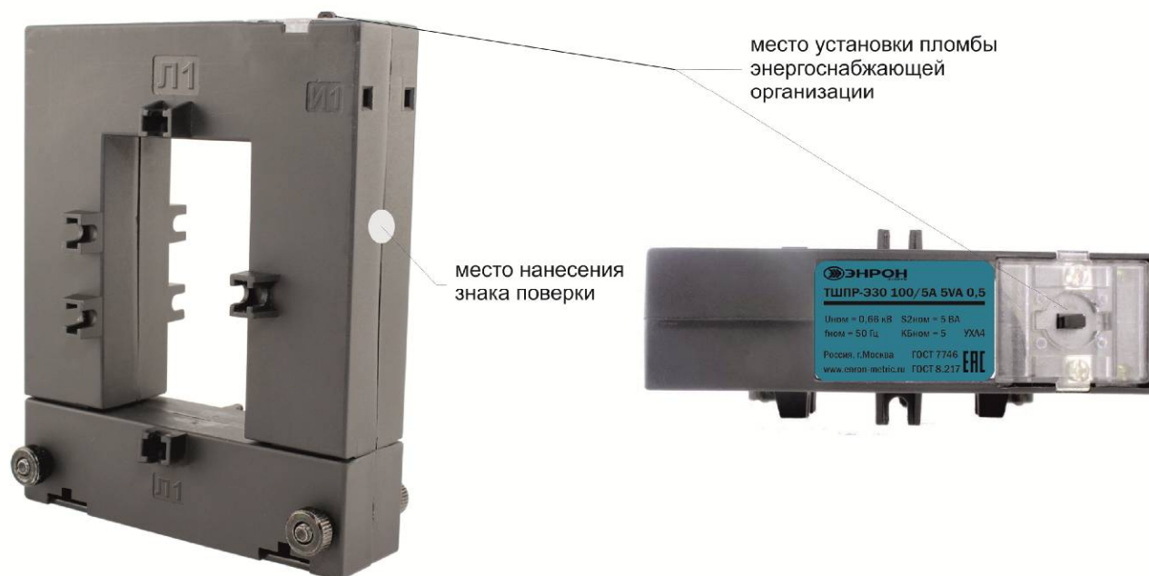
Рисунок 5 - Модификация ТШПР-Э с указанным местом нанесения знака поверки