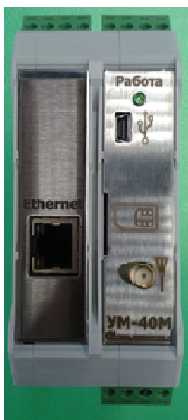
Рисунок 1 - Внешний вид устройства

Внешний вид устройства, с указанными местами размещения наклейки с данными устройства и знака поверки даны на рисунках 1 и 2.