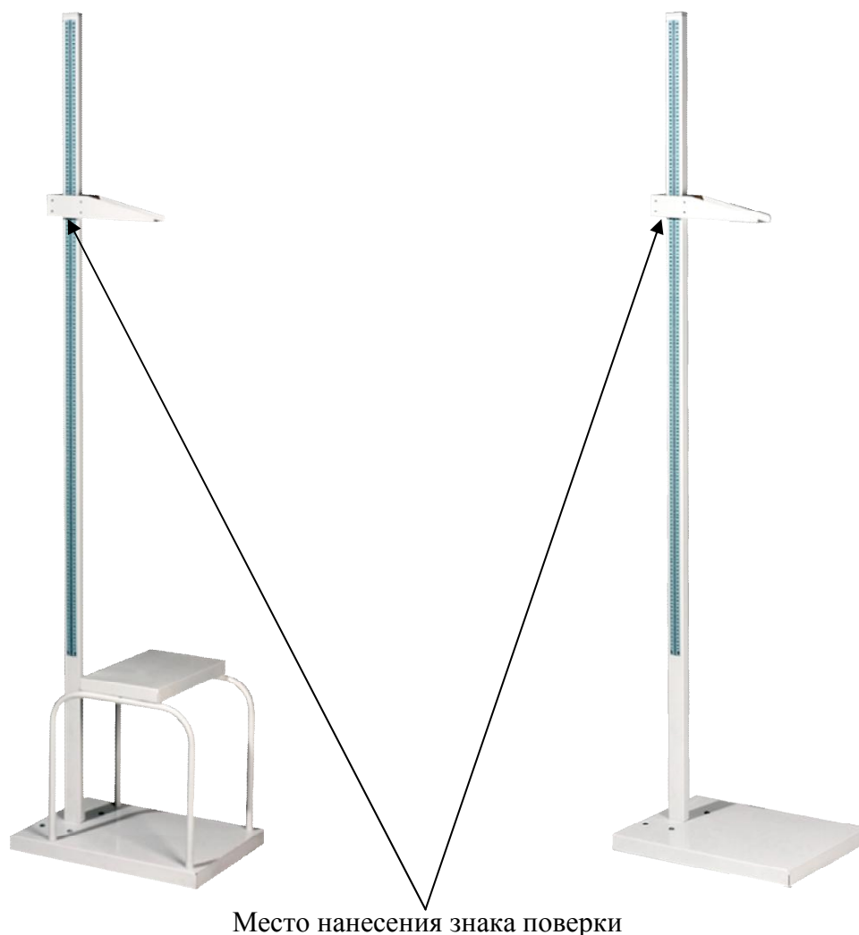
Рисунок 1 - Ростомер Р-Сс- «МСК» (МСК 233) Рисунок 2 - Ростомер Р-Ст- «МСК» (МСК 234)

Общий вид ростомеров медицинских Р - «МСК» приведен на рисунках 1 и 2.