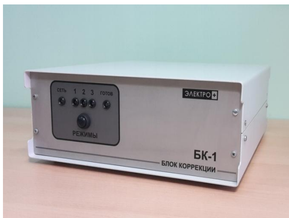
Блок коррекции БК-1

Схема пломбировки от несанкционированного доступа и нанесения знака поверки представлена на рисунке 2.