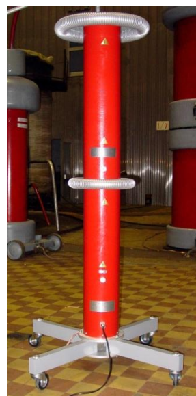
Делитель напряжения составной ДН-160пт/2