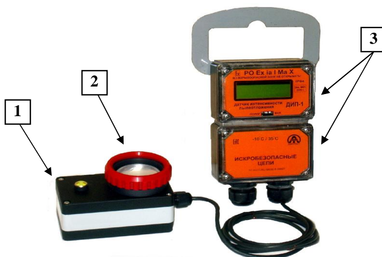
Рисунок 1 - Общий вид ДИП