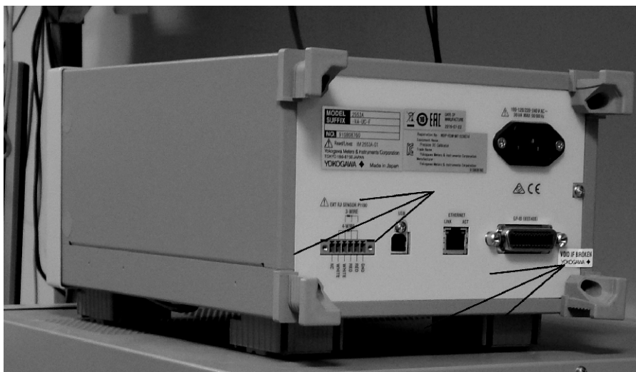
Рисунок 2 - Источник напряжения и силы постоянного тока эталонный 2553А, вид сзади

Стрелками показаны места нанесения знаков утверждения типа и поверки, а также специальная наклейка для опломбирования.