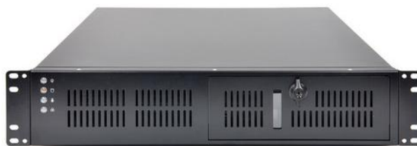
Рисунок 3 - Пример общего вида ПК

Схема пломбировки от несанкционированного доступа, обозначение места нанесения знака поверки приведены на рисунке 4 (1 - пломба в виде разрушаемой наклейки, 2 - мастичная пломба, 3 - знак поверки).