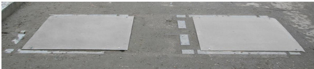
Рисунок 2 - Общий вид ГПУ модификации АВВД-2