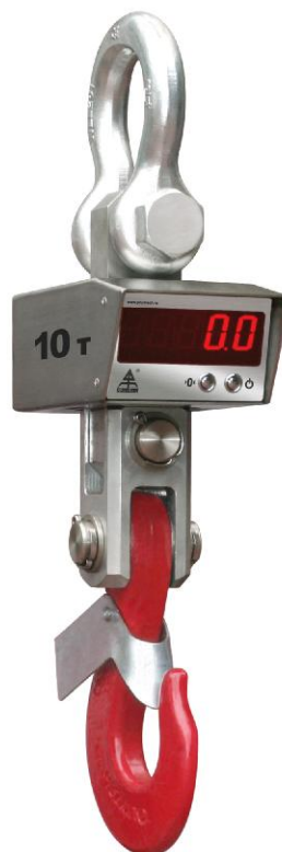
Рисунок 1 - Общий вид средства измерений