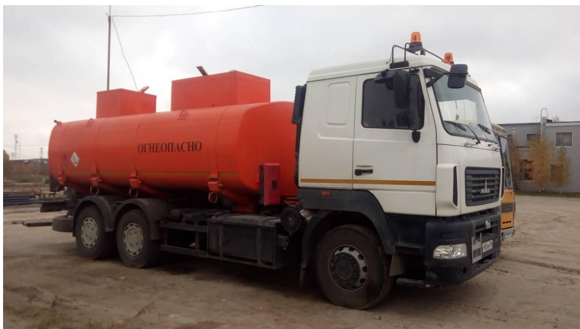
Рисунок 1 - Общий вид АЦ

Места пломбирования представлены на рисунке 2.