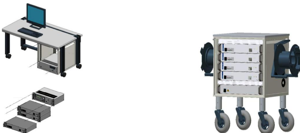
Рисунок 2 - Размещение преобразователей DDX 9121b в настольном исполнении системы (слева) и в передвижной стойке (справа)

Общий вид системы и ее элементов показан на рисунках 1 - 6.