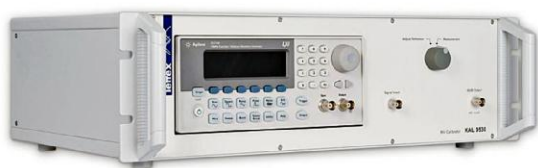
Рисунок 5 - Калибратор KAL 9530