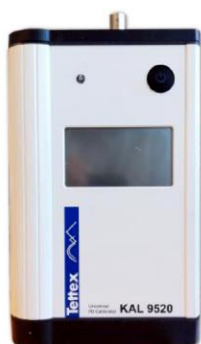
Рисунок 4 - Калибратор KAL 9520