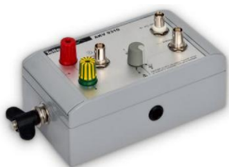
Рисунок 3 - Согласующий четырехполюсник АКВ 9310