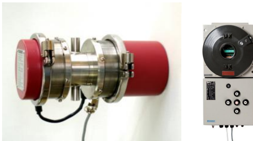
Рисунок 2 Общий вид Анализатора воды фотометрического ColorPlus EX