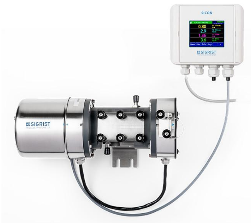
Рисунок 1 - Общий вид Анализатора воды фотометрического ColorPlus 2

Схема пломбировки от несанкционированного доступа, обозначение места нанесения знака поверки представлены на рисунке 3.