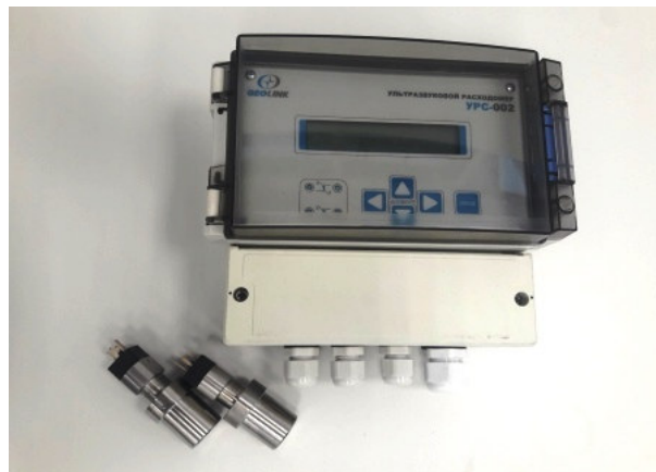
Рисунок 1 – Комплект расходомера без измерительного участка.