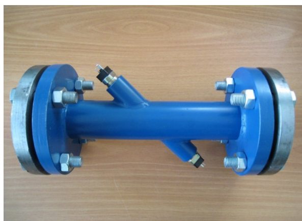
Рисунок 2 - Преобразователь расхода