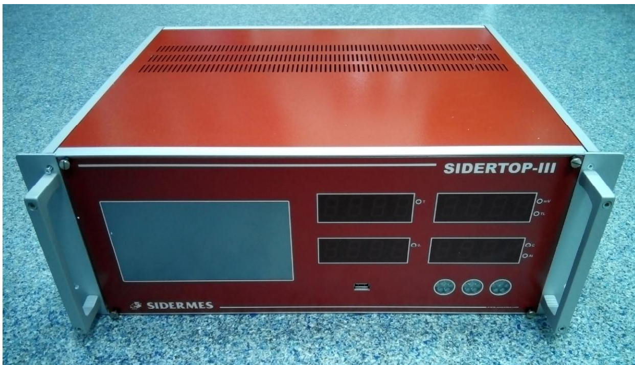
Рисунок 1 - Общий вид измерителей многофункциональных цифровых SIDERTOP-III