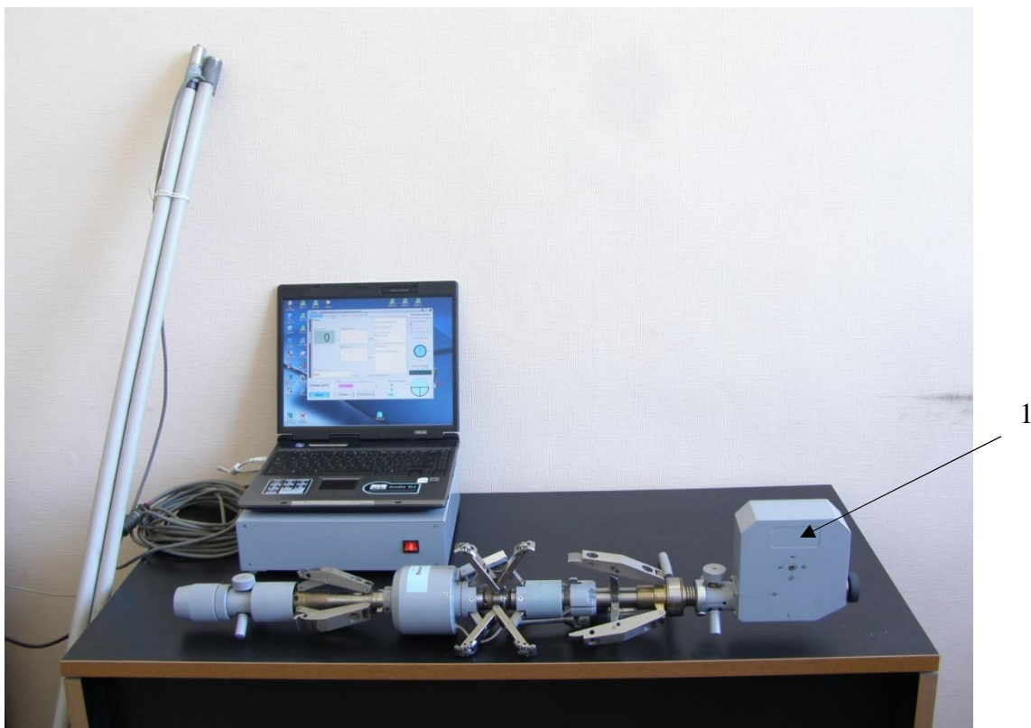
1 - место нанесения знака поверки

Общий вид приборов, обозначение места нанесения знака поверки представлены на рисунке 1.