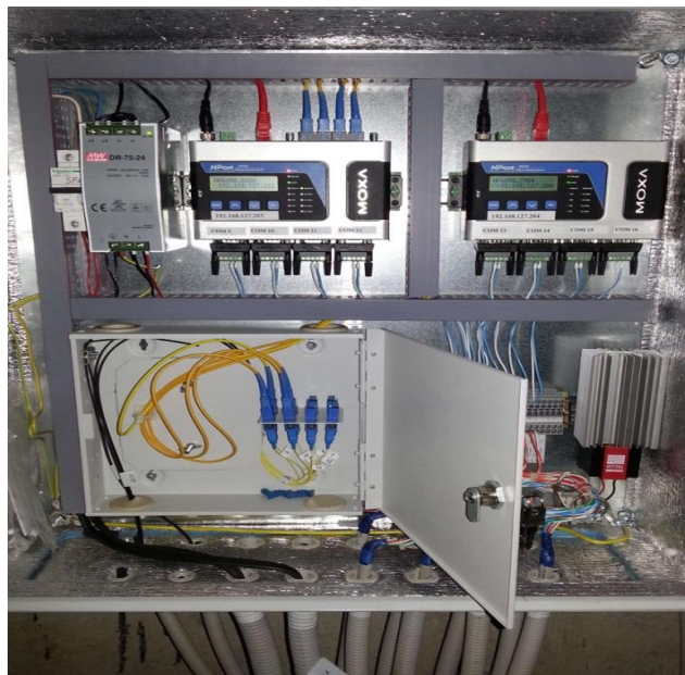
Рисунок 2 - Общий вид оптического шкафа