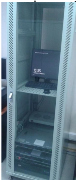
Рисунок 3 - Общий вид центрального пульта

Пломбирование интеграционных и оптических шкафов и не предусмотрено.