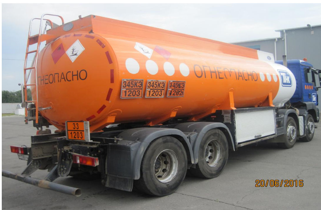
Рисунок 1 - Общий вид автоцистерны

Общий вид автоцистерны представлен на рисунке 1.