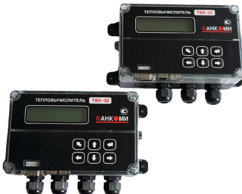
Рисунок 1 - Общий вид исполнений ТВК

Общий вид исполнений ТВК, представлен на рисунке 1.