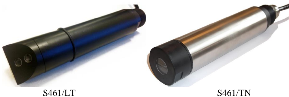
Рисунок 9 - Общий вид датчиков мутности цифровых S461/LT и S461/TN