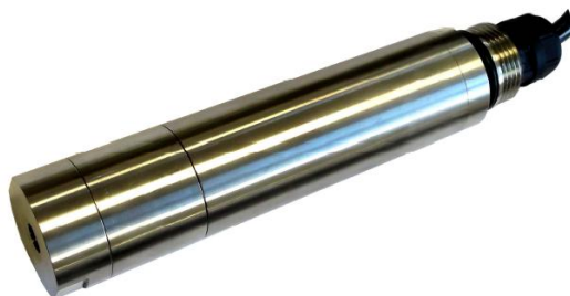
Рисунок 8 - Общий вид датчиков кислорода оптических S423/C/OPT