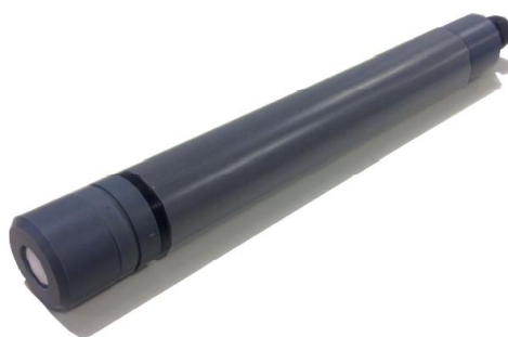
Рисунок 7 - Общий вид датчиков хлора амперометрических S494/C