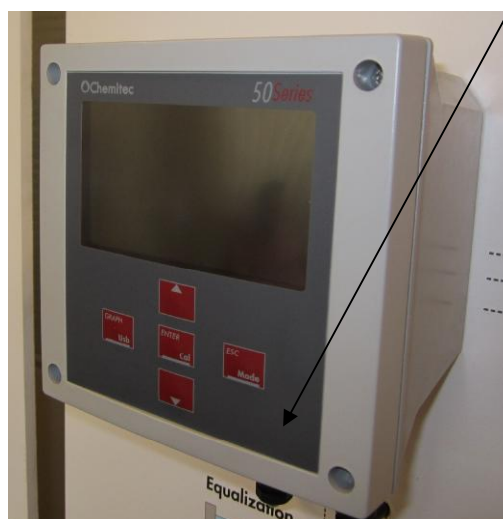
Рисунок 1 - Общий вид электронного блока анализаторов жидкости Chemitec Series 50