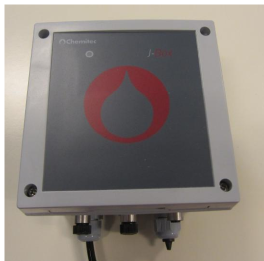
Рисунок 2 - Общий вид дополнительного электронного блока анализаторов жидкости Chemitec Series 50