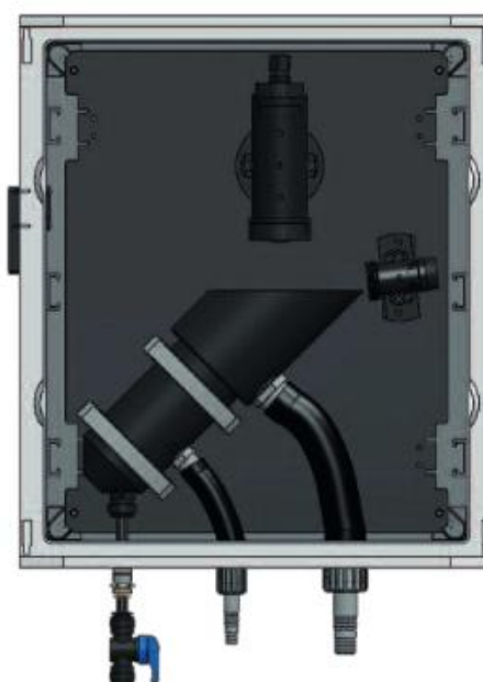
Рисунок 11 - Общий вид нефелометрической ячейки S461/N