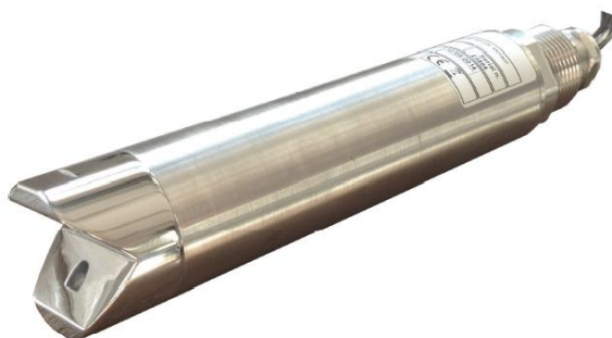
Рисунок 10 - Общий вид датчиков мутности S461/S