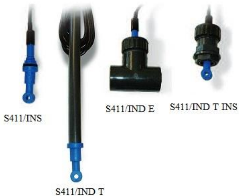
Рисунок 6 - Общий вид датчиков проводимости индуктивных S411/ IND