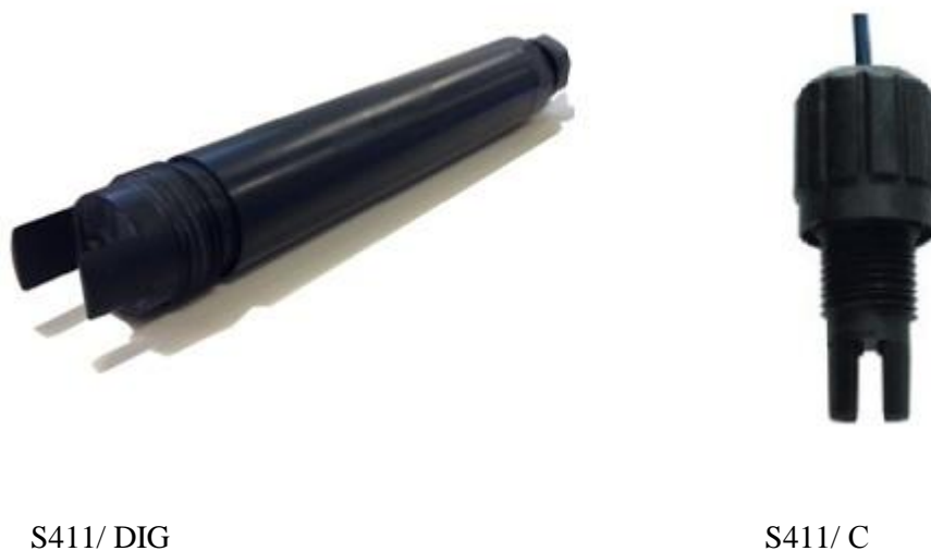
Рисунок 5 - Общий вид датчиков проводимости кондуктивных S411/DIG и S411/C