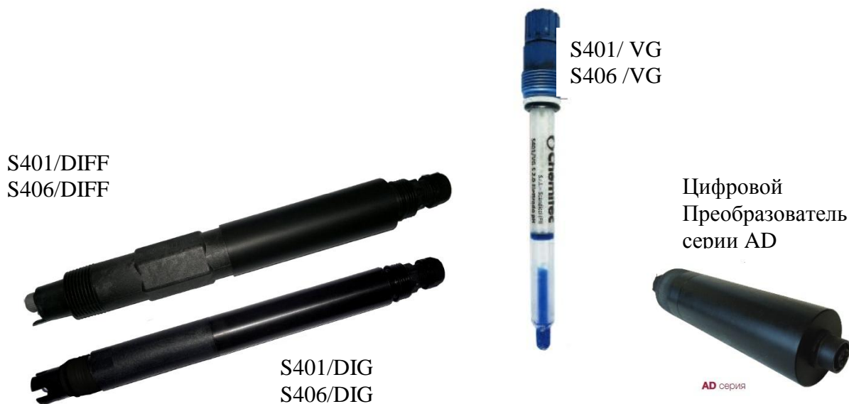
Рисунок 3 - Общий вид датчиков pH (ОВП): S401/DIG (S406/DIG), S401/DIFF (S406/DIFF), S401/ VG (S406/VG), цифровой преобразователь