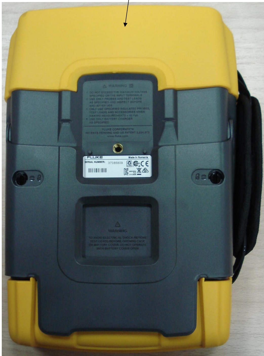
Рисунок 2 – Общий вид осциллографов Fluke 190. Вид сзади