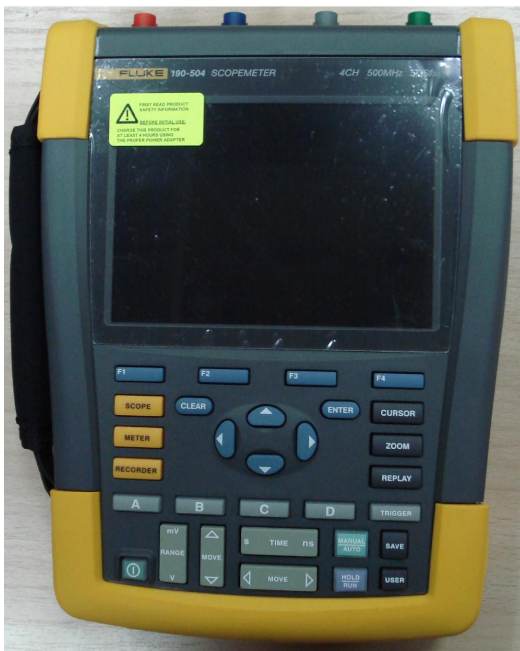
Рисунок 1 – Общий вид осциллографов Fluke 190. Вид спереди

Схема пломбировки от несанкционированного доступа представлена на рисунке 4.