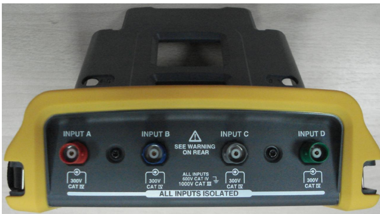
Рисунок 3 – Общий вид осциллографов Fluke 190. Вид с торца