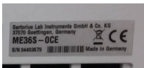
Рисунок 4 - Маркировка весов