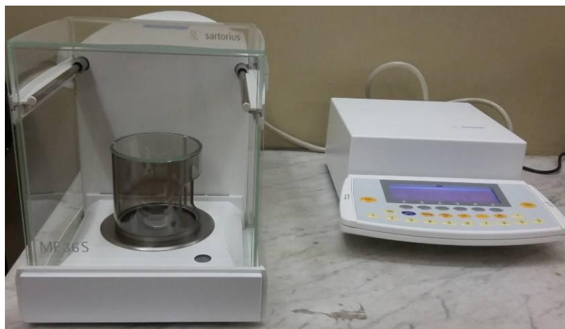
Рисунок 1 - Общий вид весов