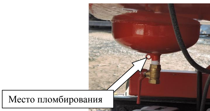
Рисунок 4 - Кран слива отстоя из АТЗ