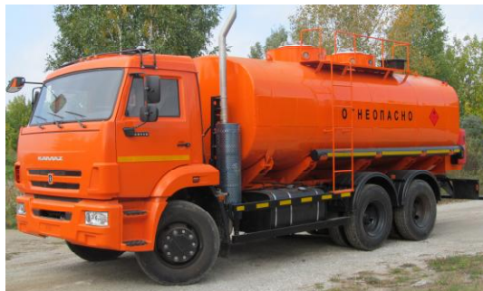
Рисунок 2 - Общий вид АТЗ С двумя секциями