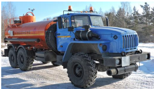
Рисунок 1 - Общий вид АТЗ с одной секцией

Общий вид АТЗ представлен на рисунке 1, 2. Место пломбирования от несанкционированного доступа обозначено на рисунке 3,4,5,6.