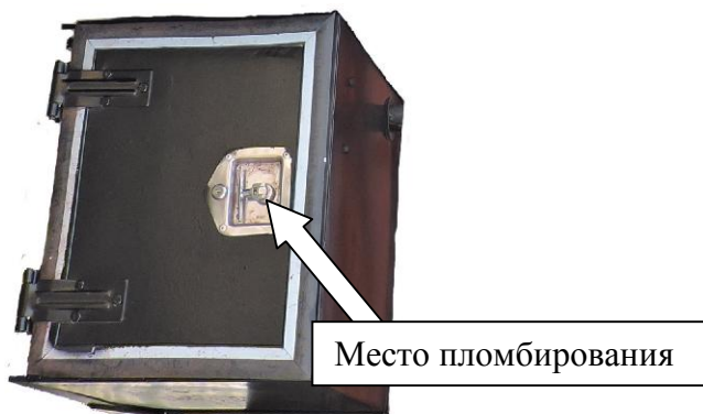
Рисунок 6 - Ручка открывания технологического отсека