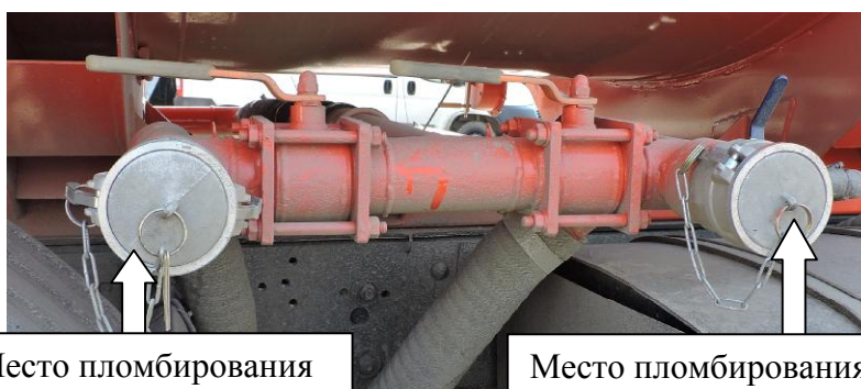
Рисунок 5 - Заглушка открывания трубопровода слива топлива из АТЗ