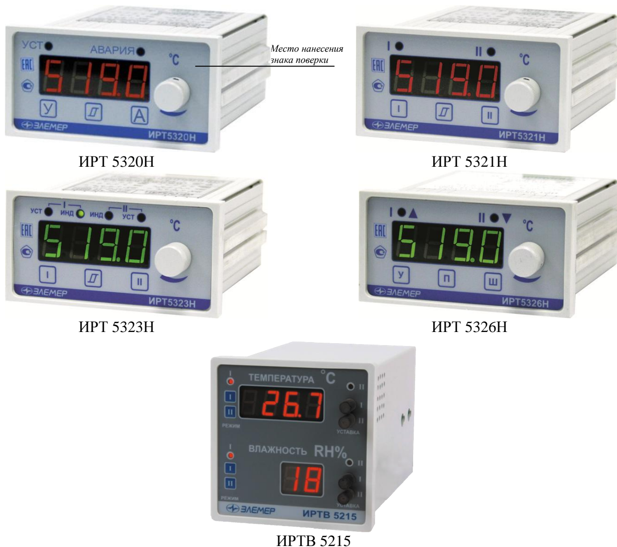
Рисунок 1 – Общий вид измерителей-регуляторов технологических ИРТ 53XXН, ИРТВ 5215 обозначение места нанесения знака поверки

Схема пломбировки от несанкционированного доступа представлена на рисунке 2.